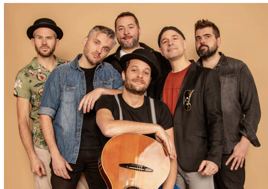
LES YEUX D'LA TÊTE