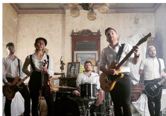
THE MANKY MELTERS+ THE LUCKY TROLLS